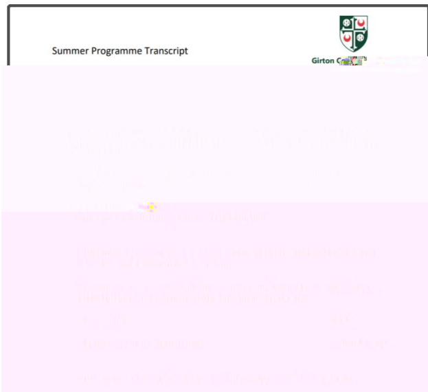
图：剑 大 学 书 与 单 图